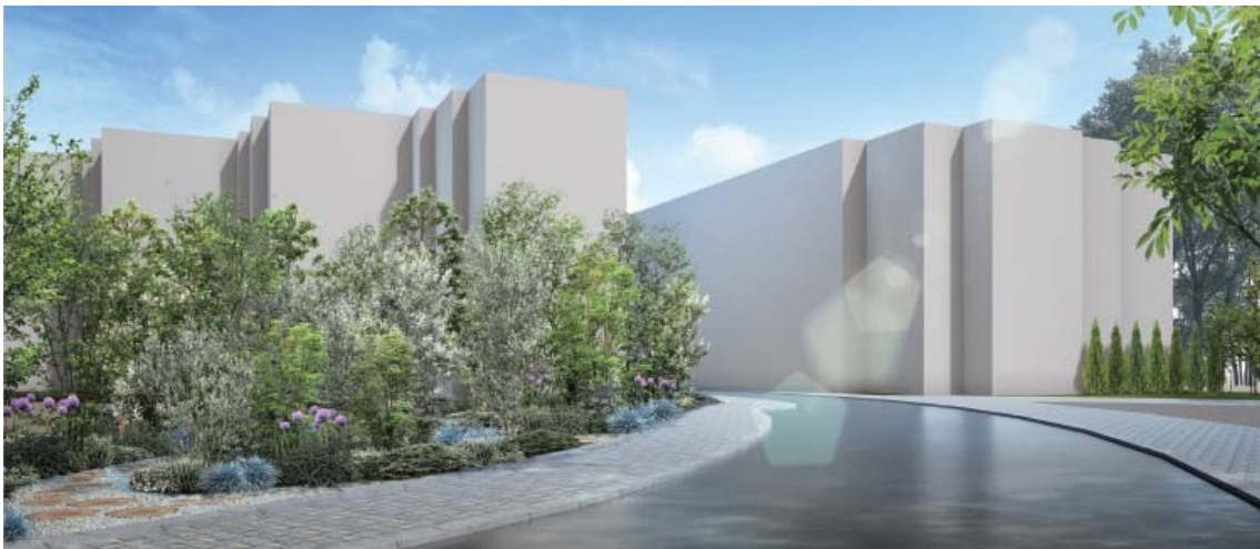
外観イメージパース

「ステラガーデン武蔵小金井（総戸数 38 戸）」は、JR 中央線「東小金井」駅徒歩 14 分、東京農工大学の南面に位置し、自然豊かな環境に佇むマンションです。当社は、 緑豊かな周辺環境に相応しい物件作り を目指して、購入当初賃貸マンションの建物全体について、大規模改修・バリューアップ工事を行うとともに、各居室内にもリノベーションを施し、区分所有のリノベーション中古マンションとして分譲いたします。